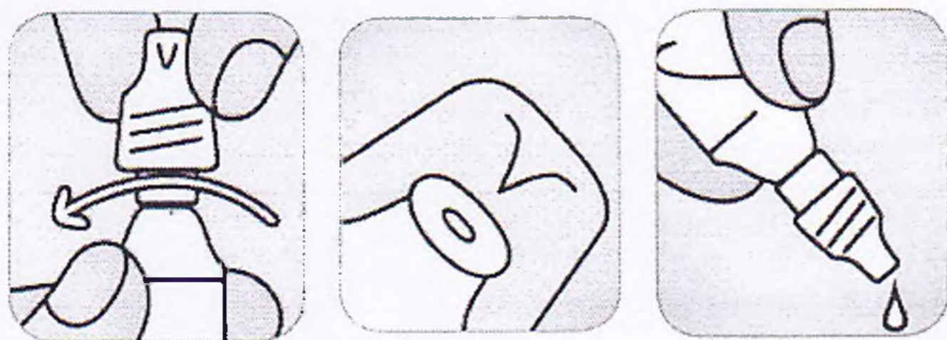
Схема відкриття флакону крапель назальних:

Краплі назальні. Дорослим – по 2 краплі; дітям віком від 1 року – по 1-2 краплі; дітям до 1 року – по 1 краплі у кожен носовий хід 3-4 рази на добу з лікувальною метою, з гігієнічною метою – 1-4 рази на добу.