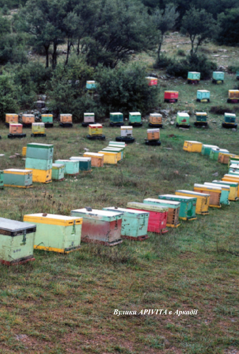
Вулики АРІВІТА в Аркадії